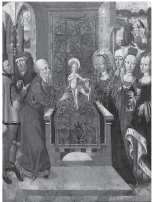
Die Darbietung des Jesus-Kindes im Tempel