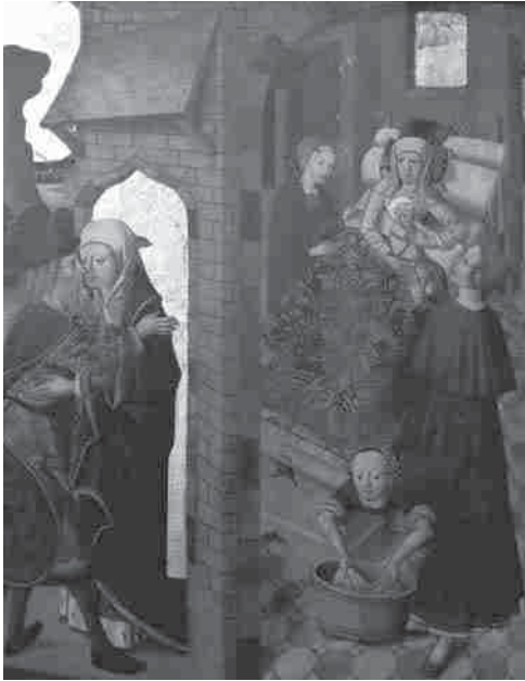
Die Begegnung Anna und Joachim an der Goldenen Pforte / Die Geburt der Maria