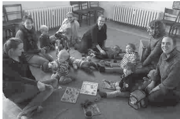
Krabbelgruppe Heiligen Geist

Herzliche Einladung zu unserer wöchentlichen Krabbelgruppe für Eltern mit Babys und Kleinkindern bis 3 Jahren. Kinder brauchen, wollen und lieben den Kontakt zu anderen Kindern schon im frühen Kleinkindalter. Sie beobachten, nehmen Kontakt auf und probieren aus.