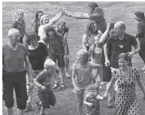
Volkstanz auf der Gemeindefreizeit

Im satten Sonnenschein und in guter Gemeinschaft sein. Mit Kindern, die spielen, bis es dunkel wird. Gemeinsam Kochen und Essen. Lachen am Lagerfeuer und lange Spaziergänge. Ein kleiner Hund an einer langen Leine. Nachdenken über die Geschichte aus der Bibel, in der Jesus tausende Menschen mit fünf Broten und zwei Fischen satt gemacht hat. Gefühlvolle Andachten, Erzählen und Basteln, Tanz und Theater. Und dabei immer ein Lied auf den Lippen. So waren die drei Tage im Schloss Dreilützow für Menschen aus den Wismarer Gemeinden, aus Proseken und Hohenkirchen: Geteilte Freude, Tiefe und Leichtigkeit. Wir haben gesehen und gefühlt: Es reicht! Danke an alle, die dabei waren und mit angefasst haben!