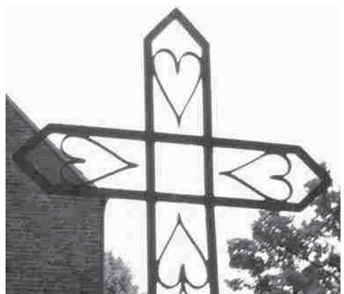
Geborgen in Gottes Liebe (Kreuz am Friedhof in Gressow)

Am Ewigkeits- bzw. Totensonntag am 25. November 2018 wird wieder auf dem Friedhof eine Andacht für Verstorbene und Trauernde gehalten werden. Sie sind dazu um 14 Uhr herzlich eingeladen.