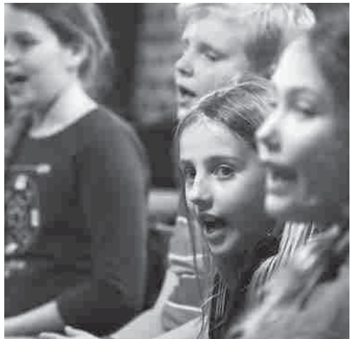
Kinderchorprobe in der Neuen Kirche