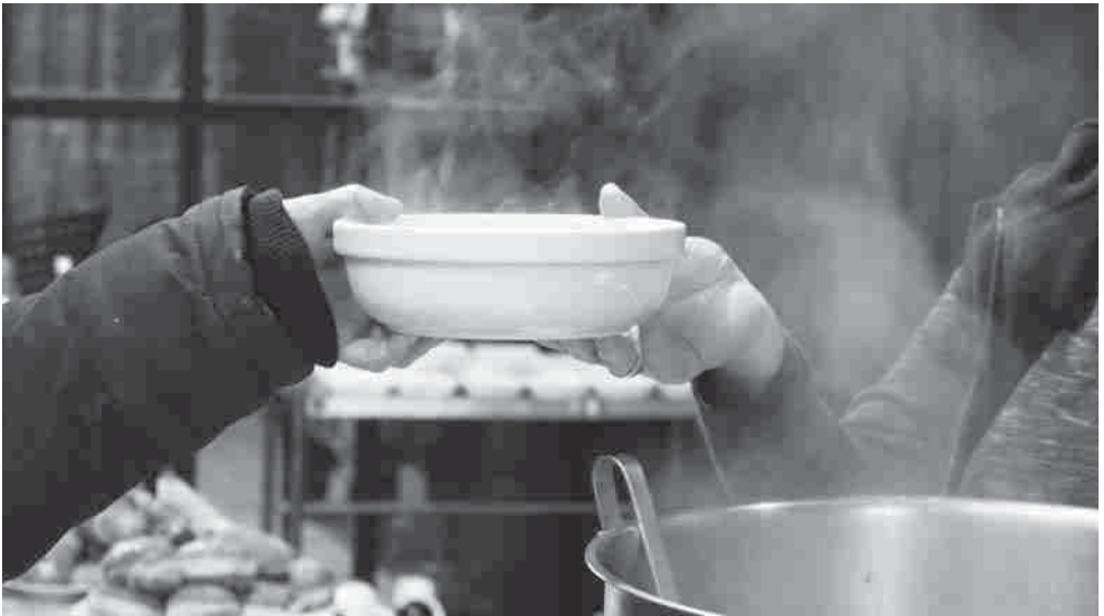
Mittags- und Suppentisch in St. Nikolai