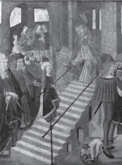
Der Tempelgang der Maria

Bilder. So entstand die Idee, zum Altar und seiner Restaurierung einen kurzen Film zu drehen, der auch die hinter dem Projekt stehenden Menschen zeigt.