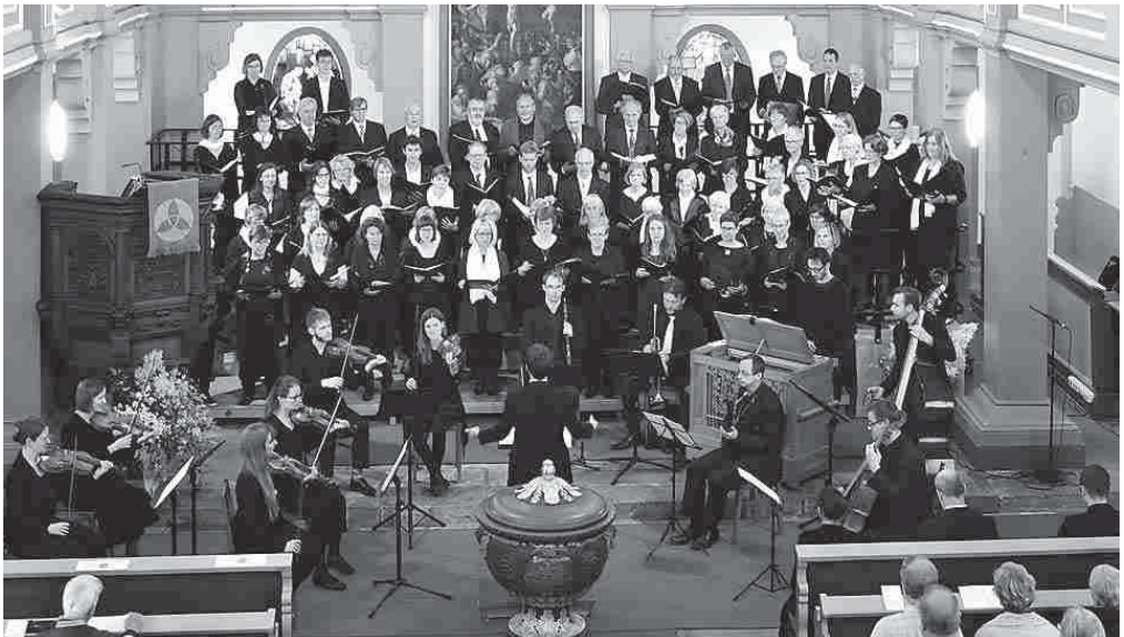
Kantatengottesdienst zu den Bachtagen in Ohrdruf